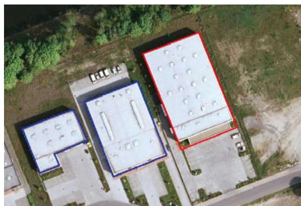
Zdjęcie 1. Wizualizacja lokalizacji obiektów ubezpieczonego. Czerwoną ramką oznaczony jest wynajmowany magazyn wyrobów gotowych Plastic-Print , niebieską - obiekty Zakładów Tworzyw Sztucznych .

Przystąpmy zatem do budowy prostego scenariusza dla typowego zakładu produkcyjnego. Pierwszym etapem jest zawsze analiza sytuacji klienta i identyfikacja ryzyk. Firma Plastics-Print* zajmuje się produkcją i zadrukiem opakowań z tworzyw sztucznych dla producentów wyrobów spożywczych. Wartość obrotu za rok 2007 wyniosła 60 mln zł. Firma zatrudnia 200 osób. Zakład wykorzystuje w procesach technologicznych palne granulaty PP, PE i PET. Przedsiębiorstwo posiada dwie hale: produkcyjną i magazynową. W pierwszej, znajdującej się na przedmieściach dużej aglomeracji, opakowania są wytłaczane i wykańczane nadrukami. Magazynowanie wyrobów gotowych odbywa się w wynajmowanym obiekcie o powierzchni 2 000 m 2 , znajdującym się na terenie innego zakładu, również z branży tworzyw sztucznych.